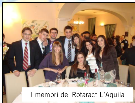
I membri del Rotaract L'Aquila